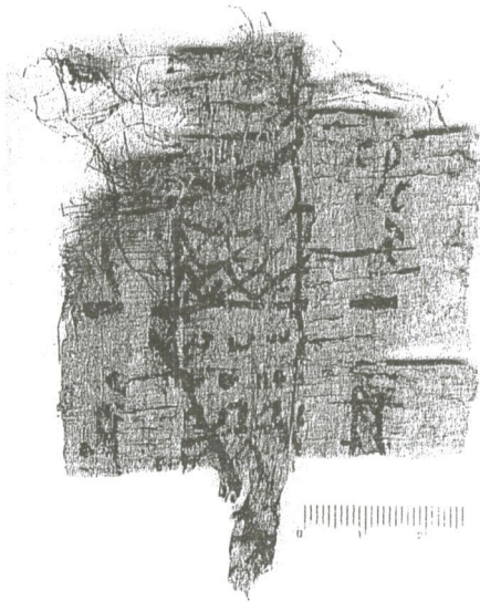
Abb. 42: Nr. 31 Rekto